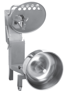
Position nettoyage Cleaning position