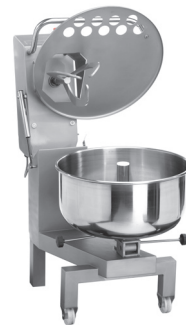
Position chargement Loading position