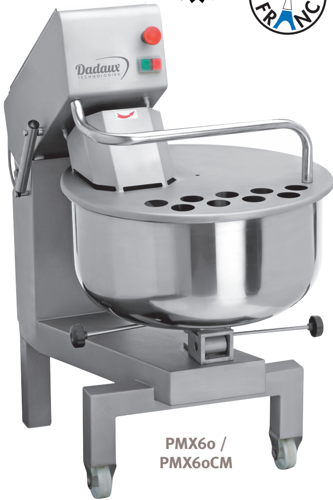
PMX60 / PMX60CM

Alimentation mono 230 V – 230V single phase motor.